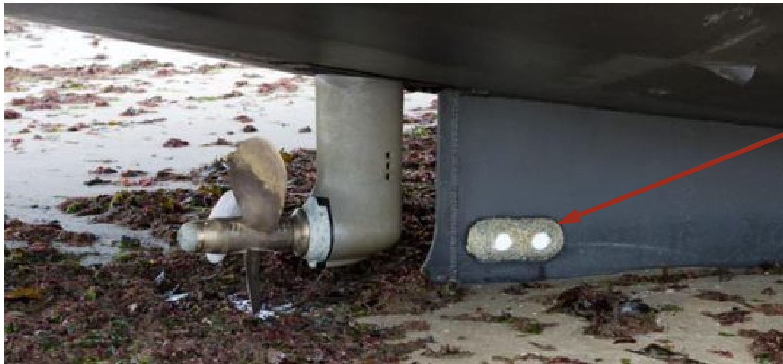
Anode sacrificielle de zinc